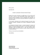
名企管培生邀请函 (表现优秀学员)

优秀学员获得【管培生邀请函】意味着未来你在港读研期间，获得长期实习岗位的面试机会，或者直接获得实习岗位！