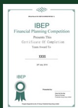
理财策划大赛证书