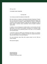
名企高层个人推荐信 (表现优秀学员)