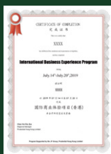
名企实习项目完成证明