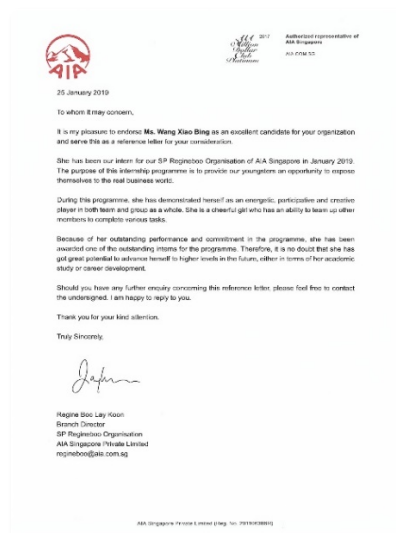
实习学员推荐证明信