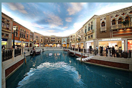
澳门威尼斯人酒店