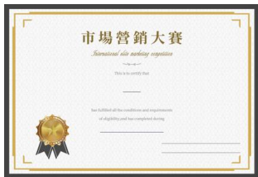
市场营销大赛证书