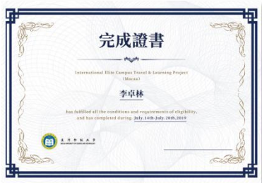
官方课程结业证书