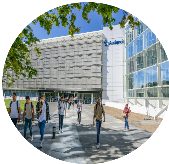
大学校 (Grande École)