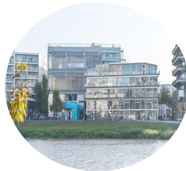
高等专科院校 (École Spécialisée)